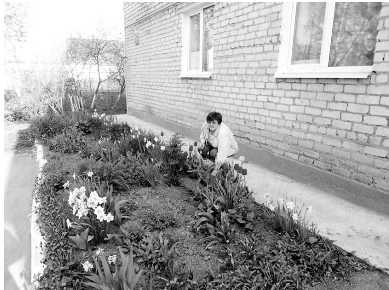
Работа на цветнике.